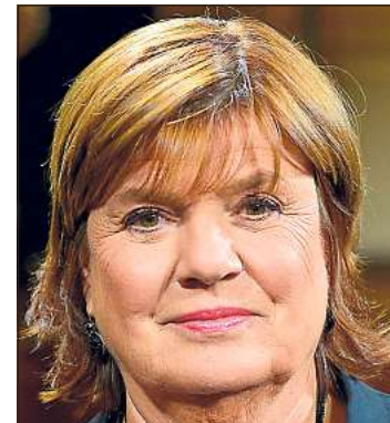
Christine Westermann ist am Montag in Warendorf zu Gast.