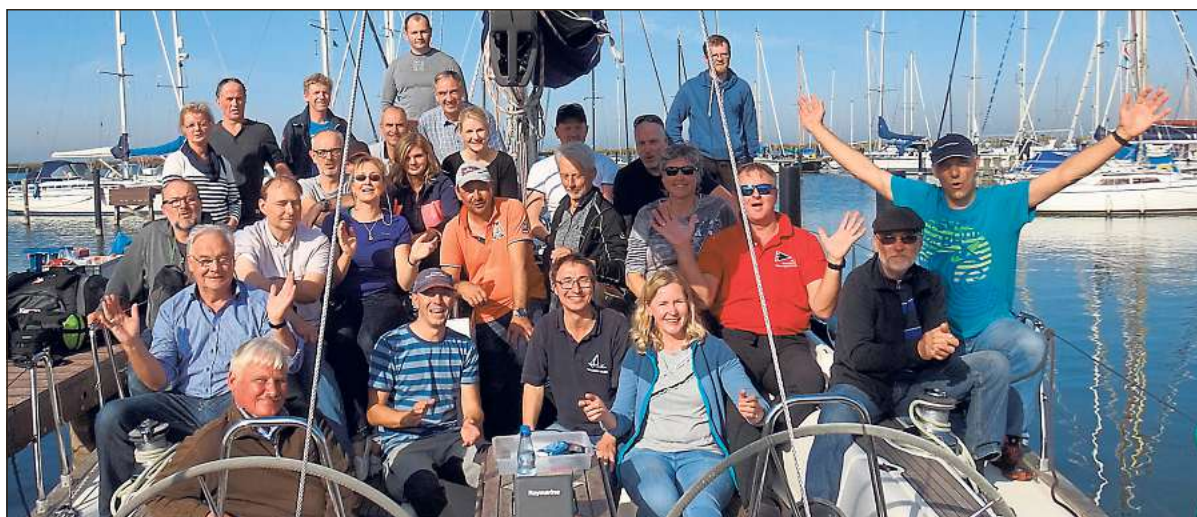
27 Segler des Warendorfer Wassersport-Vereins haben an der Saisonabschlussfahrt teilgenommen.