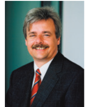
Ulrich Kasparick, MdB

Der südostafrikanische Staat Mosambik ist seit dem 5. Juni 1975 unabhängig von der portugiesischen Kolonialmacht. 1986 verfiel das Land in einen Bürgerkrieg, der zu einem völligen wirtschaftlichen Zusammenbruch führte. Erst 1992, nach über 900.000 Toten und 1,3 Millionen geflüchteten Menschen, konnte das Land mit Hilfe von UN-Friedenstruppen stabilisiert werden. Anfang 2000 führten schwere Regenfälle zu einer Flutkatastrophe, die zahlreiche Menschenleben forderte, ein Rückschlag für das aufstrebende Land. Maputo hat über zwei Millionen Einwohner. Viele davon leben in Slums. HIV/AIDS ist ein großes Problem, rund 15 % der Bevölkerung sind betroffen. Mosambik gehört zu den 10 ärmsten Ländern der Welt.