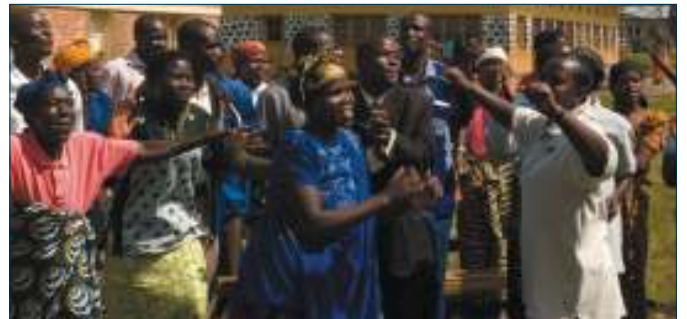
Clementine feiert mit ihrer Trustbank-Gruppe