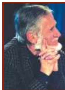
Dr. Rupert Neudeck, Vorsitzender der Grünhelme e.V.

Menschen schaffen es, sich dank der Kredite ein eigenes Geschäft aufzubauen. Mit viel Einfallsreichtum und noch mehr Energie erarbeiten sie sich ihre eigene Lebensgrundlage und die ihrer Familien. Besser kann Ihre Spende nicht angelegt sein.“