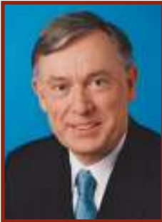
Horst Köhler, Bundespräsident

„Ich habe in vielen Entwicklungsländern Not, Hunger und Chaos erlebt. Andererseits habe ich dort Menschen kennen gelernt, die sich nicht unterkriegen lassen. Vor allem Frauen versuchen mit unglaublicher Beharrlichkeit, für ihre Kinder aus der Not etwas Gutes zu machen. Sie meistern ihr Schicksal mit einer Würde, wie ich das vorher nirgendwo erlebt habe. Kleinkredite können dabei eine wichtige Hilfe sein und den Weg in eine bessere Zukunft bahnen. Kleinkredite sind mehr als Almosen. Sie helfen denen, die ihre Lebensbedingungen eigenständig verbessern wollen und sind deshalb eine wichtige Hilfe zur Selbsthilfe. Schon ein kleiner Beitrag kann viel verändern. Wenn wir es ehrlich meinen mit der Menschlichkeit auf diesem Globus, können wir die Menschen in den Entwicklungsländern nicht vergessen oder fallenlassen.“