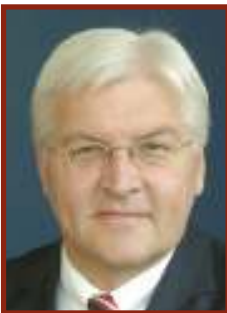
Frank-Walter Steinmeier, Bundesaußenminister

„Ich habe in vielen Entwicklungsländern Not, Hunger und Chaos erlebt. Andererseits habe ich dort Menschen kennen gelernt, die sich nicht unterkriegen lassen. Vor allem Frauen versuchen mit unglaublicher Beharrlichkeit, für ihre Kinder aus der Not etwas Gutes zu machen. Sie meistern ihr Schicksal mit einer Würde, wie ich das vorher nirgendwo erlebt habe. Kleinkredite können dabei eine wichtige Hilfe sein und den Weg in eine bessere Zukunft bahnen. Kleinkredite sind mehr als Almosen. Sie helfen denen, die ihre Lebensbedingungen eigenständig verbessern wollen und sind deshalb eine wichtige Hilfe zur Selbsthilfe. Schon ein kleiner Beitrag kann viel verändern. Wenn wir es ehrlich meinen mit der Menschlichkeit auf diesem Globus, können wir die Menschen in den Entwicklungsländern nicht vergessen oder fallenlassen.“