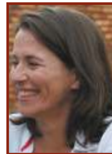
Anne Will, Fernseh-Moderatorin und Botschafterin bei GEMEINSAM FÜR AFRIKA

Ich wünsche ihnen viel Erfolg und hoffe, dass sie die Unterstützung erhalten, die sie verdienen!“