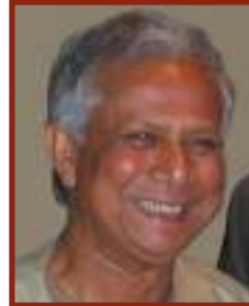
Muhammad Yunus, Friedensnobelpreisträger 2006

„Die Nachhaltigkeit der Arbeit von Opportunity International ist für mich entscheidend. Der Geldtransfer in die Entwicklungsländer führt hier zu einem Kreislauf des Helfens. Menschen, die sonst niemals die Chance hätten an Kapital zu kommen, erhalten eine echte Lebensperspektive für sich und ihre Familien.“