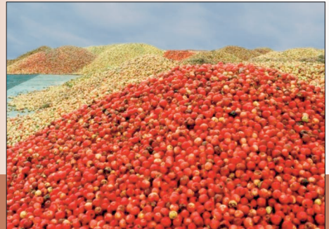
Nahrung zu Müll machen