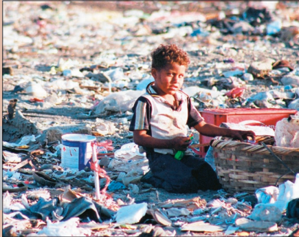
Nahrung im Müll suchen