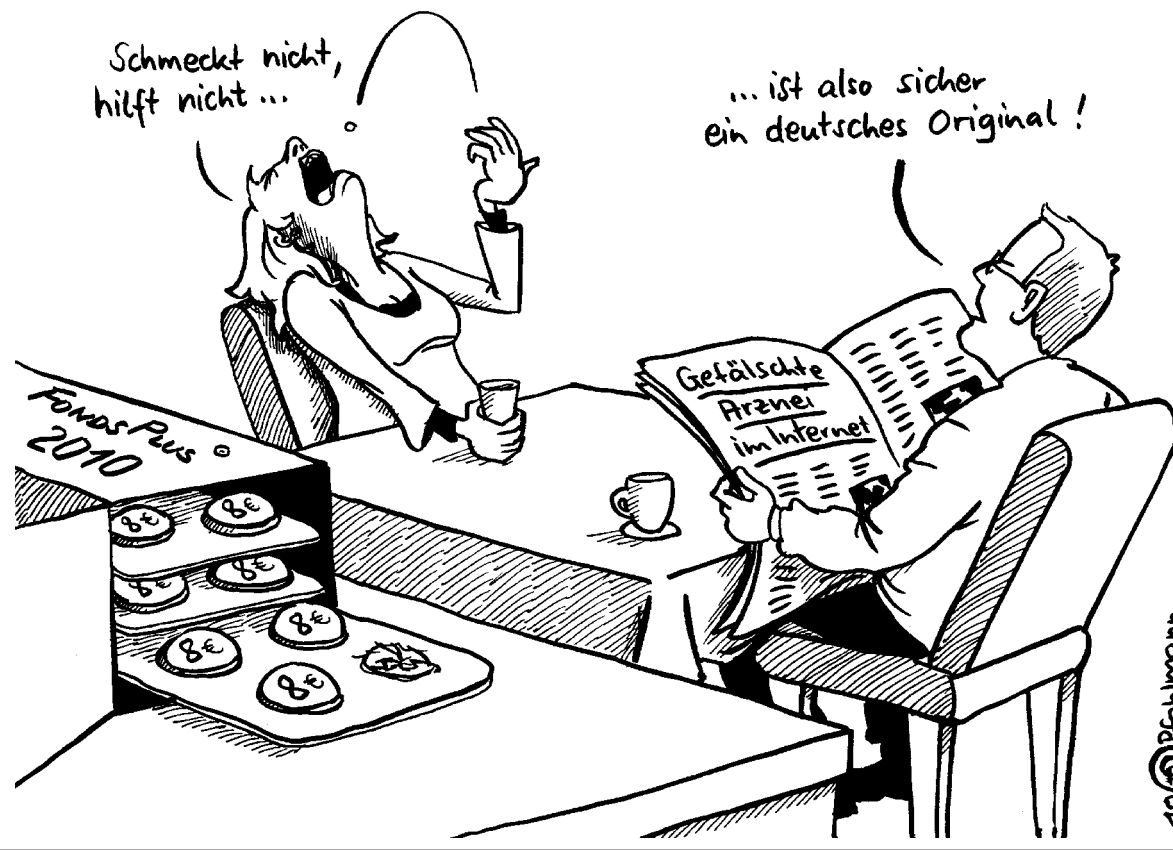
Karikatur: Christiane Pfohlmann

Früher pflegten vor allem die C-Parteien der politischen Linken einen unverantwortlichen Umgang mit Geld vorzuhalten. Das können sie nicht mehr. Ihre beliebte Berufung auf Ludwig Erhard klingt schon lange hohl. Längst beherrschen auch bei ihnen Verteilungspolitiker die Bühne. Denn sie wissen: Wer was anderes sagt, wird abgewählt. Wird die Lage irreparabel und unreformierbar? Jedenfalls wird auch künftig manche schlechte Nachricht zur scheinbar guten umgedeutet werden. (Wirtschaft)