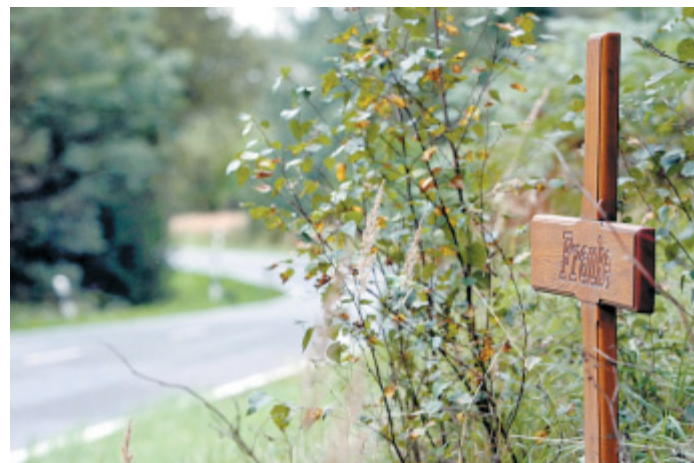
Erinnerung: Am Fundort der Leiche von Frauke Liebs südlich von Paderborn steht ein Kreuz an der Straße.

■ Paderborn. Um Geld zu sparen, erwägt die Stadt Paderborn, etwa ein Drittel aller Spielplätze zu schließen und dafür größere, zentrale Spielflächen einzurichten. Das geht aus einer Vorlage der Verwaltung hervor, die heute im Jugendhilfeausschuss behandelt werden soll. Jährlich könnten so bis zu 144.000 Euro bei der Pflege gespart werden.