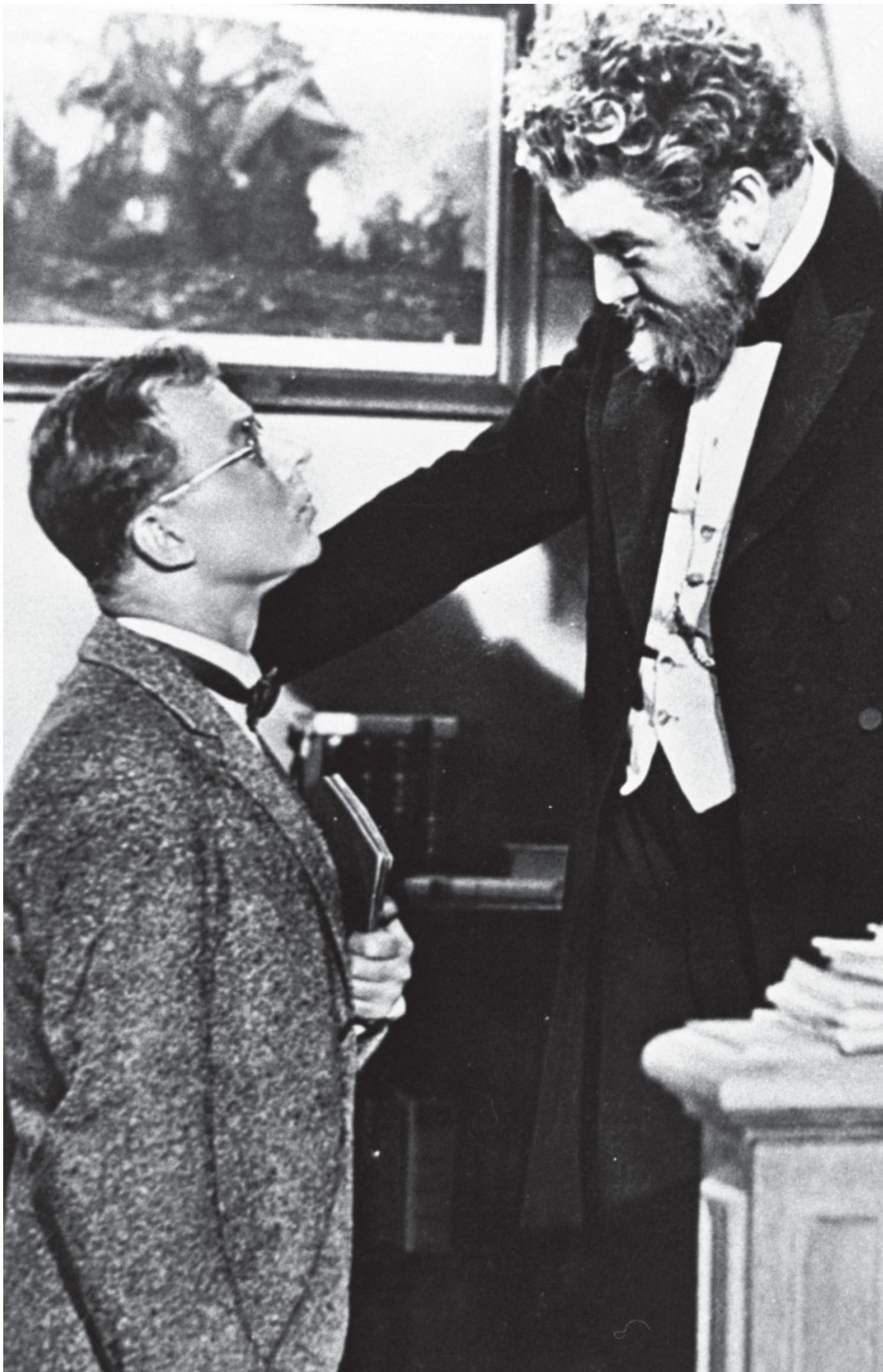
Lehranstalt: Im Film „Die Feuerzangenbowle“ ermahnt Direktor Knauer (Hans Leibelt, r.) Schüler Hans Pfeiffer (Heinz Rühmann).

Mathematik und Naturwissenschaften wurden für den Test 2009 nicht ausführlich überprüft, aber hier zeigt sich, dass die deutschen Schüler weiter oberhalb des Durchschnitts liegen. In Mathematik nehmen sie mit 513 Punkten den zehnten Platz ein. Und in den Naturwissenschaften liegt Deutschland mit 520 PISA-Punkten auf dem neunten Platz.