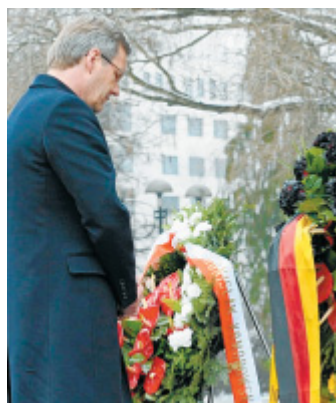
Stilles Gedenken: Bundespräsident Wulff in Warschau.

Der einstige Solidarnosc-Aktivist Komorowski sagte: „Wir haben die Chance, die Geschichte zu korrigieren.“ Wulff hob in einer Rede ausdrücklich die Rolle