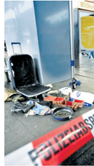
Geöffnet: Dieser Koffer löste einen Großalarm aus.

■ Ein herrenloser Koffer am Düsseldorfer Hauptbahnhof hat für Chaos im Bahnverkehr gesorgt. Weil der Bahnhof eine Stunde lang komplett gesperrt war, fielen während des Berufsverkehrs zahlreiche Züge aus, andere hatten erhebliche Verspätung. Insgesamt seien 150 Züge betroffen gewesen, so ein Bahnsprecher. Die Bundespolizei gab schließlich Entwarnung. Der Koffer habe keine Bombe, sondern lediglich Alltagsgegenstände und Müll enthalten. Die Bundespolizei rief Reisende dazu auf, besser auf ihr Gepäck zu achten, um ähnliche Einsätze zu verhindern. Sie warnte vor hohen Kosten, die als Verursacher von Polizeieinsätzen und Zugverspätungen zukommen könnten. (dapd)