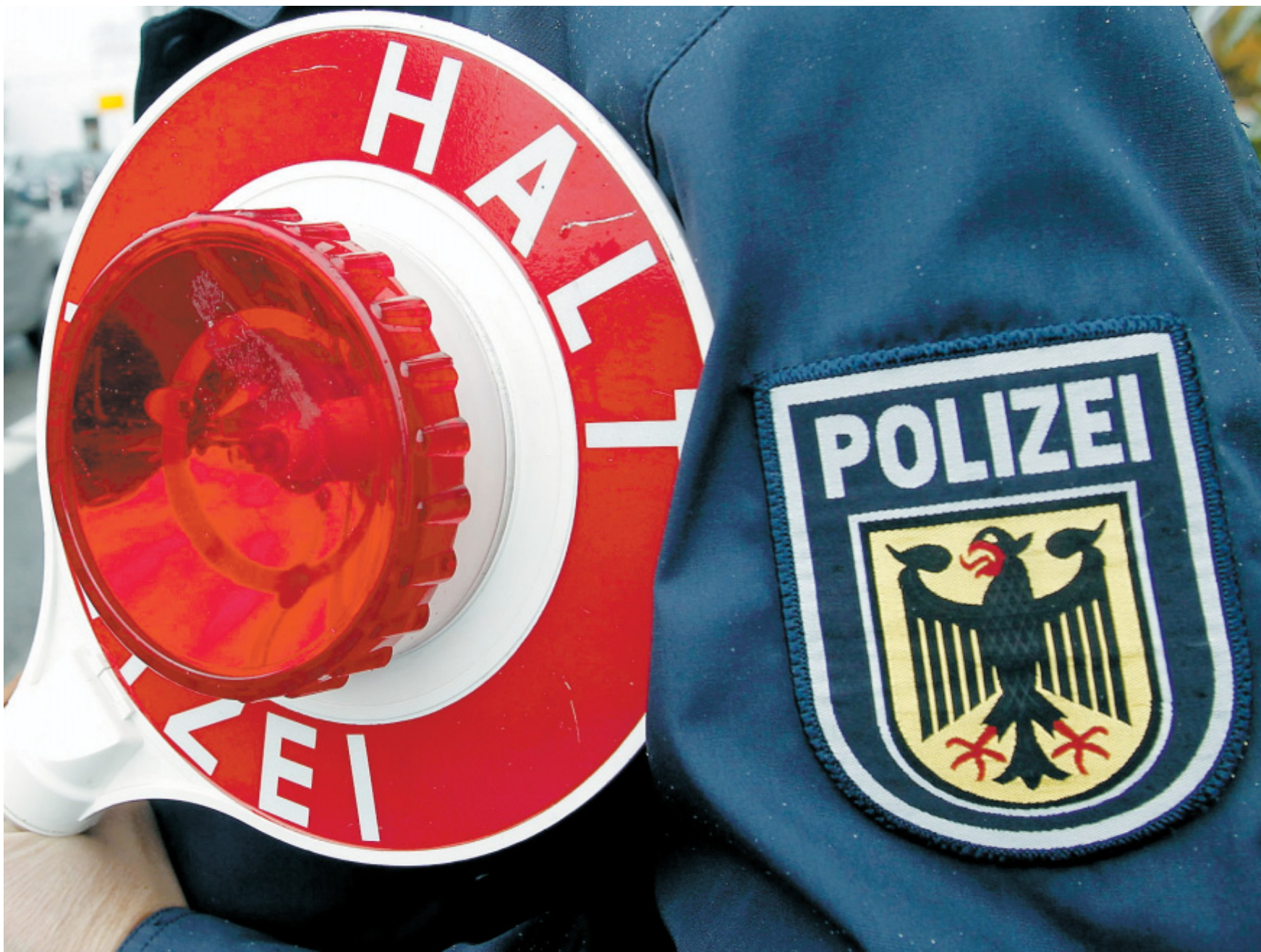
Unübersehbar: Die öffentliche Polizeipräsenz hat in der Bundeshauptstadt und rund um die Regierungseinrichtungen dieser Tage deutlich zugenommen.

Zu einer Art kollektivem Aufstöhnen bei allen Politikern