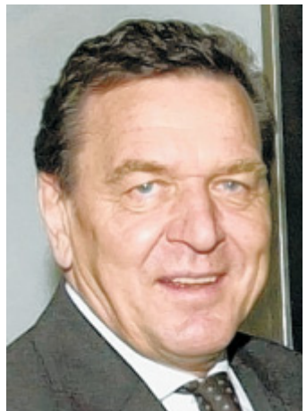
Erinnert sich: Altkanzler Gerhard Schröder.

Der Streit ist massiv – sagt doch einer der auf Glaubwürdigkeit Bedachten die Unwahrheit. Für Schröder geht es auch um die historische Einordnung seiner Lebensleistung. Durch den drohenden Irakkrieg war Schröders Wiederwahl 2002 stark gefährdet. Laut Umfragen waren 80 Prozent der Deutschen gegen eine deutsche Beteiligung, was den Demoskopiepolitiker Schröder als Unwilligen aus der vom US-Präsidenten ausgerufenen „Koalition der Willigen“ ausscheren ließ. Sein „Nein“ zum Irakkrieg möchte er hoch angerechnet wissen. Basta!