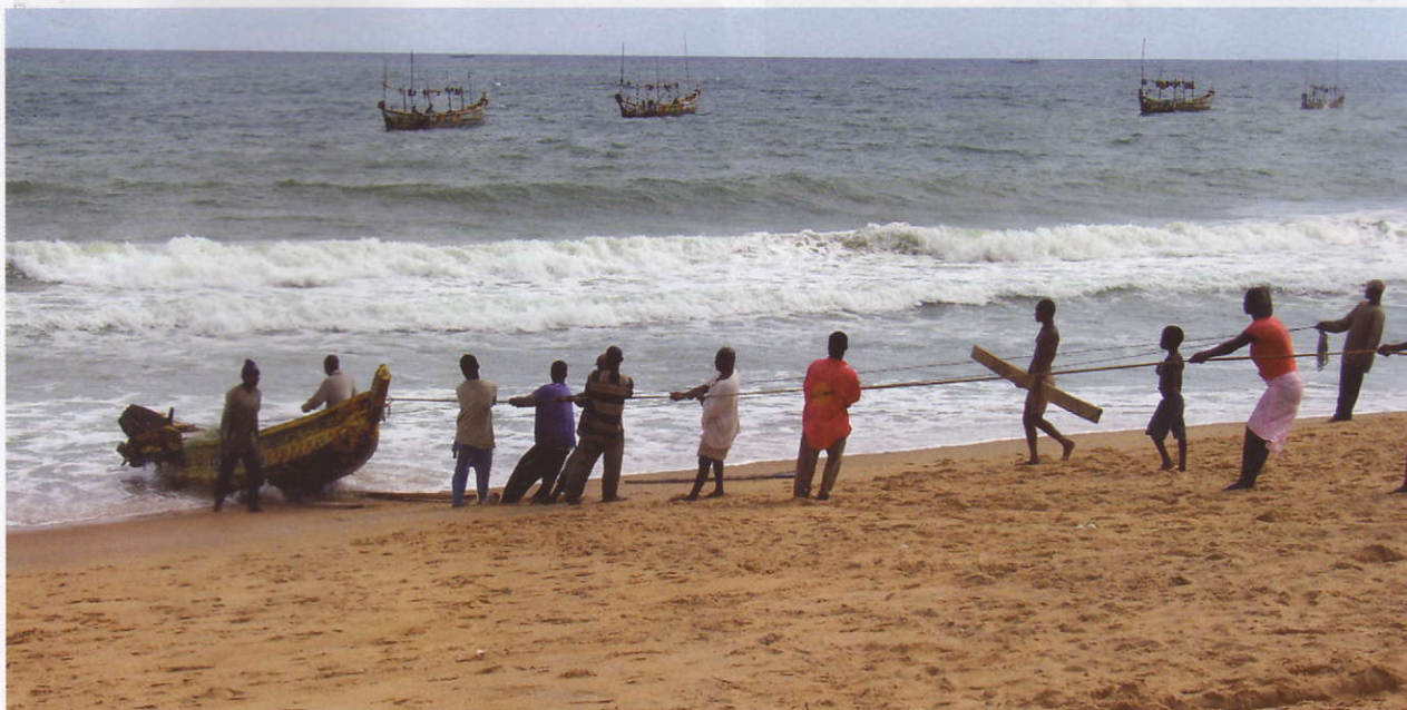
Zupacken gefragt – leider vertrinken und verspielen die Männer oft ihr wenig Kapital.