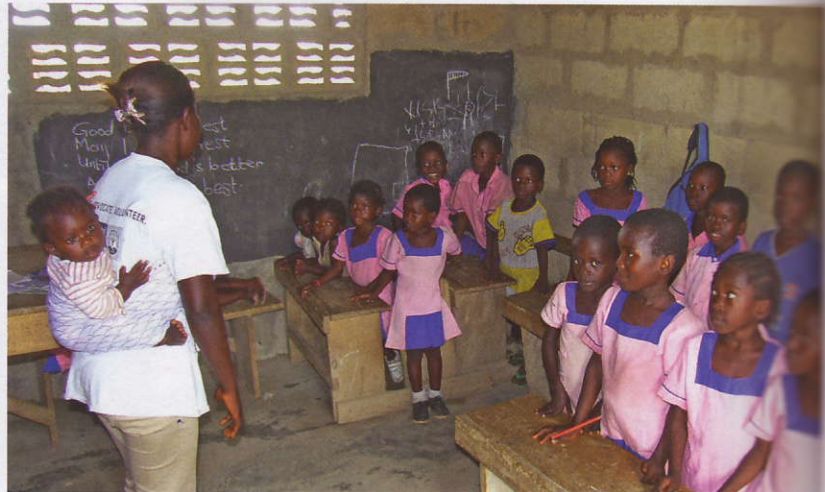
Für viele ein Ausdruck der Hoffnung – die mit stolz getragene Schuluniform

benötigen nur kleine Summen und bieten keine Sicherheiten außer ihrer Geschäftsidee. Yunus setzte als Sicherheit auf zwei Komponenten: eine begleitende Schulung für die Existenzgründer und auf die Verbindlichkeit einer Gruppe. Die Kreditnehmer gründen mit jeweils acht bis zehn Personen eine „Trust-Bank“, eine Art kleiner Genossenschaft, in der einer für den anderen bürgt. Ein hervorragendes Modell für den ländlichen Raum, der mit seiner hohen sozialen Verbindlichkeit