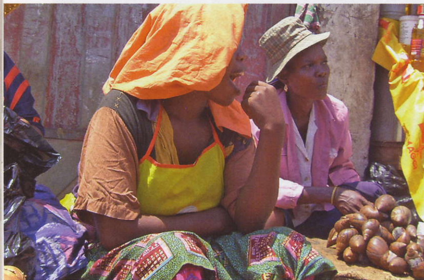
Bewegerinnen: Nur jeder zehnte Existenzgründer ist ein Mann.

Die meisten Frauen wollen ihren Kindern eine gute Schulausbildung ermöglichen. Doch die staatlichen Schulen sind oft überfüllt, die Lehrer sind schlecht bezahlt und entsprechend wenig motiviert. Als Alternativen entstehen vielerorts Privatschulen, häufig in der Trägerschaft einer der unzähligen christlichen Kirchen in Ghana. Ein Schilderwald säumt die Straßen: „New Charismatic Church“; „Bishop Ndabi Revival Church“; „Universal Baptists“; „Assembly of Ghana“ und so weiter und so fort. SAT unterstützt auch die Schulprojekte mit Krediten. Sie refinanzieren sich über Schulgeld. Den Eltern ist die gute Ausbildung der Kinder etwas wert. Und die Kleinen