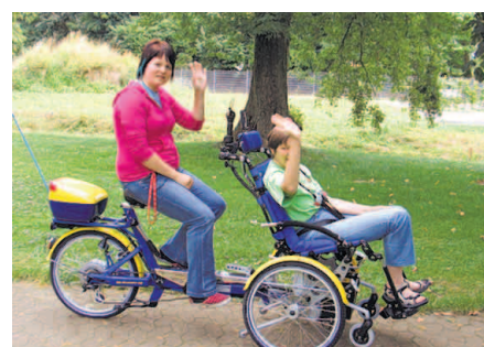
Eine Firma entwickelt Fahrräder für Menschen mit Behinderungen