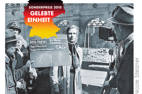
Ein Filmverleih macht historische deutsche Filme weltweit bekannt