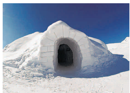
Iglu-Hotels auf der Zugspitze setzen Zeichen im Kampf gegen Erderwärmung