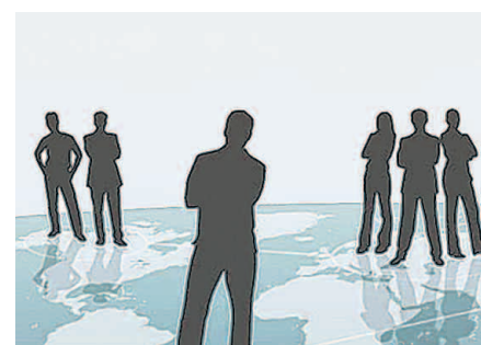
Ein Business-Netzwerk im Internet entwickelt sich zum Portal für Events weiter