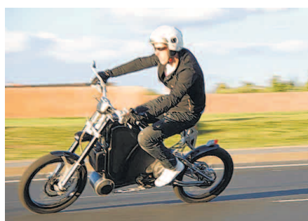
Ein neuartiges Elektrofahrrad kombiniert Muskel- und Maschinenkraft