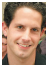
Aus Australien berichtet Thomas Schöneich

■ Sydney. Welches Wort wählt man, um eine Katastrophe zu beschreiben, die inzwischen fast jedes erdenkliche Ausmaß übertrifft? Im australischen Bundesstaat Queensland ist eine Fläche so groß wie Deutschland und Frankreich zusammen überschwemmt. Zehn Menschen sind bereits in den Fluten ums Leben gekommen. Und für viele der 200.000 Betroffenen ist das Schlimmste noch nicht überstanden.