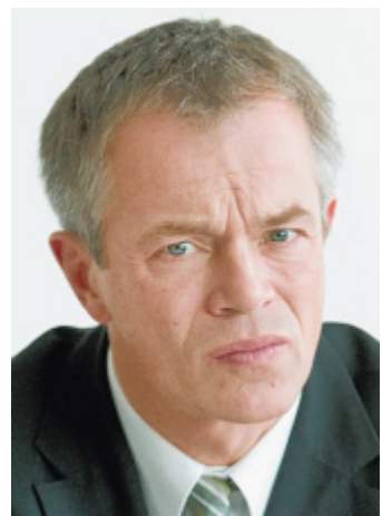
Fordert Konsequenzen: Minister Johannes Remmel.

Bio-Anbauer-Verbände hatte in den vergangenen Jahren immer wieder kritisiert, dass der Marktanteil der Bioanbauern in Deutschland stark gesteigert werden konnte, die Nachfrage aber vor allem von ausländischen Anbietern befriedigt wird. Einer der Gründe: Der Bioanbau konkurriert mit erneuerbaren Energien wie Biogas, aber auch der Tierhaltung um die Fläche. Gegenwärtig arbeiten rund 1.900 landwirtschaftliche und Gartenbaubetriebe alternativ und bewirtschaften dabei rund 66.500 Hektar Fläche. Das sind rund 4,4 Prozent der landwirtschaftlichen Nutzfläche des Landes NRW.