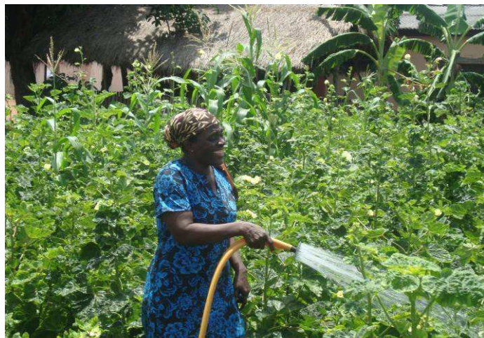
Eine Kleinbäuerin bei der Bewässerung ihrer Okraschoten

Unter den Kleinbauern sind häufig auch alleinerziehende Mütter, Witwen oder Frauen ohne jede Schulbildung, die hart arbeiten müssen, um ihre Familie zu versorgen. Diese Frauen bleiben meist in der Armut gefangen, egal wie hart sie arbeiten, da sie kein Betriebskapital besitzen, um gutes Saatgut, einfache Ackergeräte oder Pestizide zu kaufen, geschweige denn, die für manche Ernte notwendigen Helfer einzustellen.