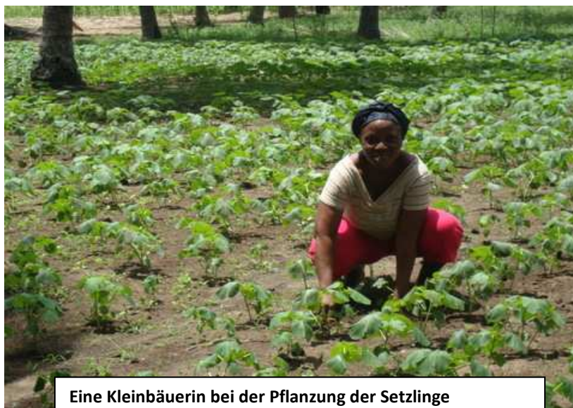
Eine Kleinbäuerin bei der Pflanzung der Setzlinge

Die Voltaregion mit der Hauptstadt Ho ist für ihren dynamischen Handel bekannt. Dies liegt sowohl an den wirtschaftlichen Aktivitäten als auch an der geographischen Lage: sie ist verkehrstechnisch gut mit den nördlichen und westlichen Regionen Ghanas sowie mit der Hauptstadt Accra vernetzt und damit für Händler geeignet, um